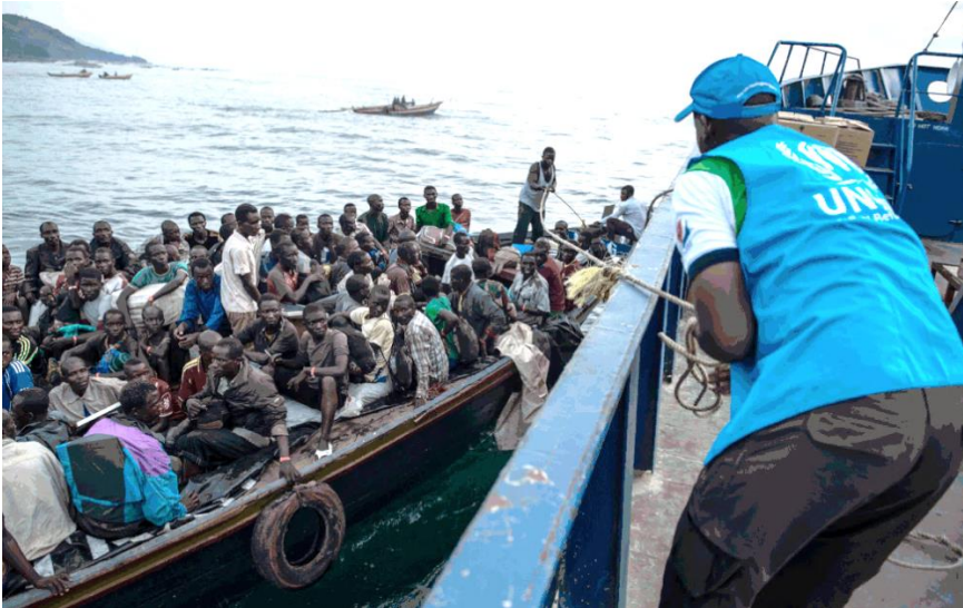
Refugiados chegam em barco lotado; foto da exposição "FACES DO REFÚGIO"

Desse total, quase 26 milhões são considerados refugiados pelos padrões do Acnur. Síria e Venezuela são pontos de preocupação da agência. Pedidos de refúgio no Brasil dobraram em um ano.